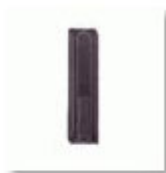
Schwenkhebelverschluss inkl. PHZ 10/30 mm, selbstschließend