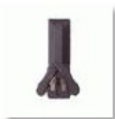
Schwenkhebelverschluss / DoppelschlieÙe inkl. 1 x PHZ 10/30 mm, selbstschließend

Weitere Zusatzausstattung ist auf Anfrage erhältlich: