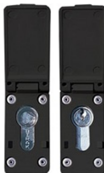
Kastenschloss mit Vorrichtung für PHZ und Dreikant