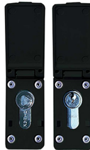
Doppelschließung (Optional) Selbsttätig schließend, inkl. 1 x Drei- kantschloss u. 1 x vorger. für PHZ 10/30