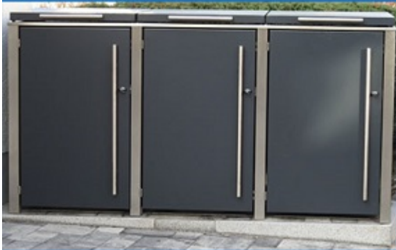
• Türen ohne Lochung