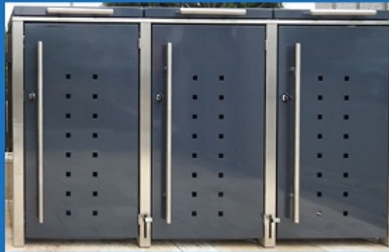
• Türen mit Lochmuster