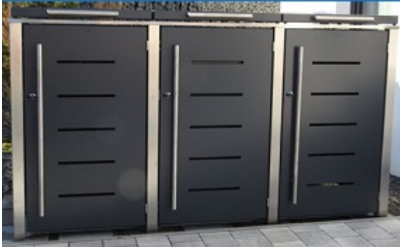
• Türen mit Schlitzmuster