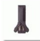
Schwenkhebelverschluss / Doppelschließe inkl. 1 x PHZ 10/30 mm, selbstschließend

Weitere Zusatzausstattung ist auf Anfrage erhältlich: