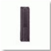
Schwenkhebelverschluss inkl. PHZ 10/30 mm, selbstschließend